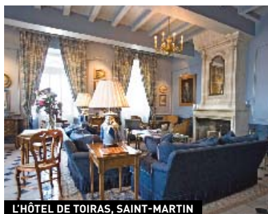
L'HÔTEL DE TOIRAS, SAINT-MARTIN