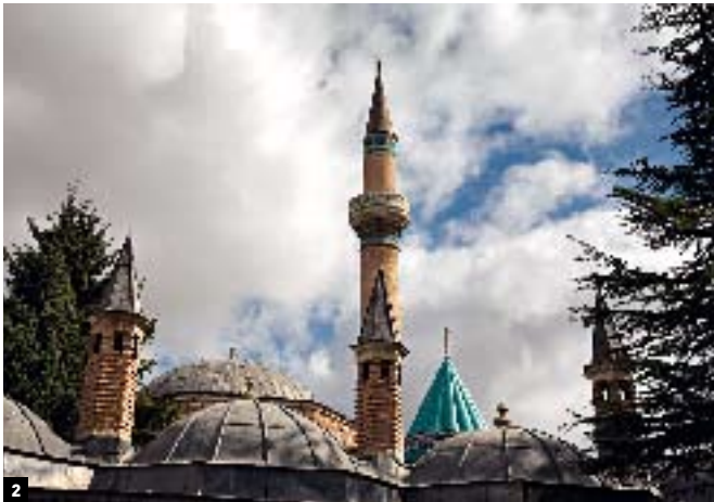
SPURENSUCHE 1 Um 200 n. Chr. gab es in Kappadokien viele Christen. Deren Kirchen finden sich in den Felsen des Freiluftmuseums Göreme 2 Für den Brückenschlag