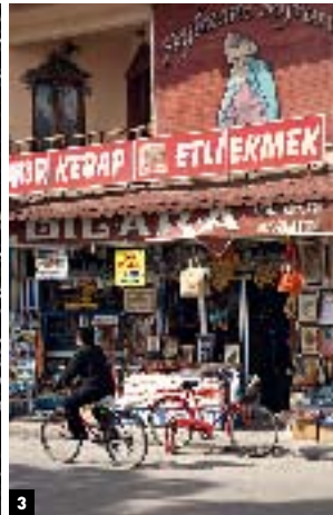
der Religionen stehen Rumi und die Mevlana-Moschee in Konya 3 Die stilisierte Figur des Weisen ist allgegenwärtig im Land. Hier über einem Kramladen in Konya

dens Mevlana und Sufi-Meister kann gerade jetzt, in international gefeierten Jubiläumszeiten – 800 Jahre nach seiner Geburt – die Regierung in Ankara kaum etwas einwenden. Schon gar nicht, wo die UNESCO den seit Atatürk offiziell verbotenen Wirbeltanz der Derwische zum Weltkulturerbe erklärt hat. Ein geheimnisvolles Ritual, bei dem die Sufis in weißen Gewändern mit schwarzen Überwürfen und hohen Filzhüten zu mit Zither-, Flöten-, Trommelmusik und Gesang intonierten spirituellen Versen von Rumi erst langsam, dann schneller und schneller um die eigene Achse kreiseln. Bis sie in jenen tranceartigen, bewusstseinsweiternden Zustand gelangt sind, in dem sich das Irdische mit dem Erha-